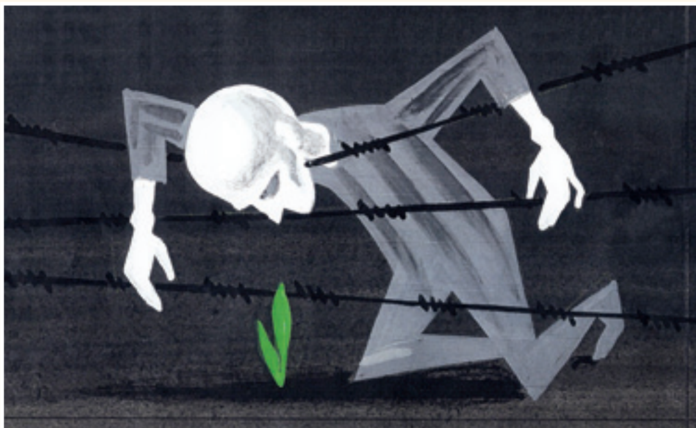
"ללכת אל הגדר" מאת הצייר: פאול קור

סיפור השרדותם ותקומתם של שורדי השואה חברי ודיירי בית אבות ליאון רקנאטי בפתח-תקווה בשיתוף הצעירים תלמידי שכבה ט' בחטה"ב ע"ש 'אחד העם'