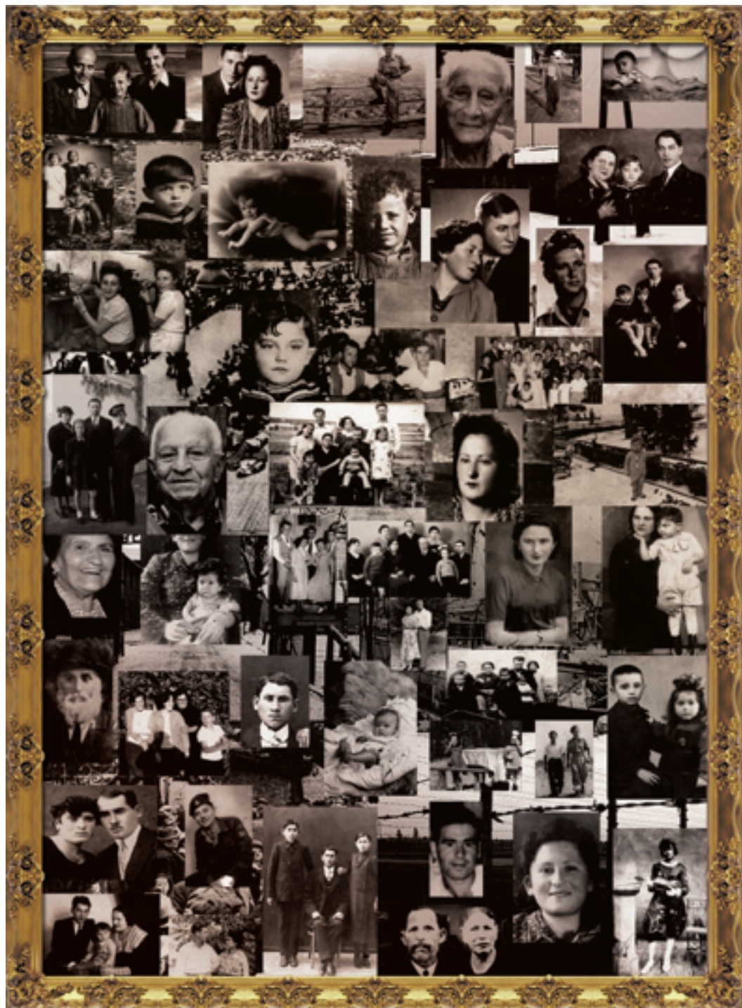
קולאז' - אלבום משפחתי עריכה וביצוע: אולג קונוט