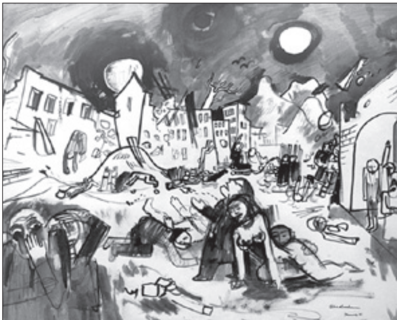
'האסון הגדול', ציור של פליקס נוסבאום, 1939 (נרצח באושוויץ)

מעין ברוש | המנהלת הכללית, עמותת חותם - לקידום ופיתוח החינוך והתרבות בפתח-תקווה