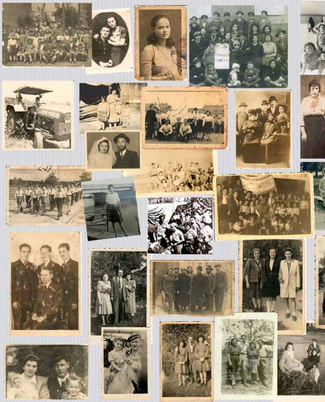
"אלבום משפחתי" קולאז תמונותיהם של משתפי הפרויקט