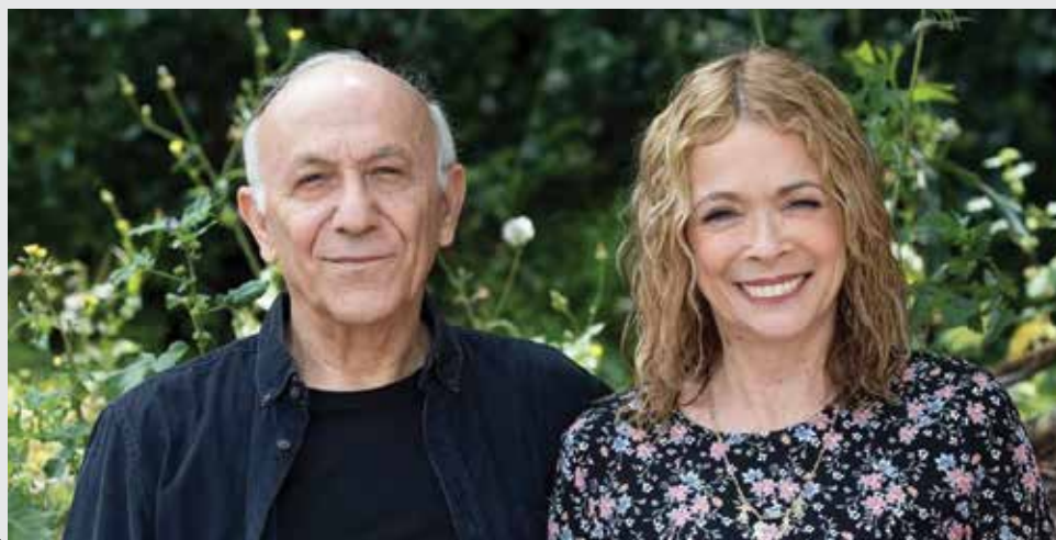
איורים: שרה שלמון

במציאות בה אנו חיים היום, בה ישנם אנשים שאומרים: "שואה לא קרתה", במציאות בה האנטישמיות עדיין קיימת, בה רצח עם קורה בכל רגע בכל כך הרבה מקומות בעולם, מציאות בה עדיין יש גזענות ושנאה ושנאת חינוך, לצערנו נותר להבין כי העולם לא באמת למד מאותם מאורעות של אותה מלחמה. אנחנו צריכים לזכור ולהזכיר, ללמוד וללמד, כי עלינו חובת ההנצחה. למען אותם ניצולים, למען אלו שלא ניצלו, למענו ואולי בעיקר למען כל אלו שיבואו אחרי."