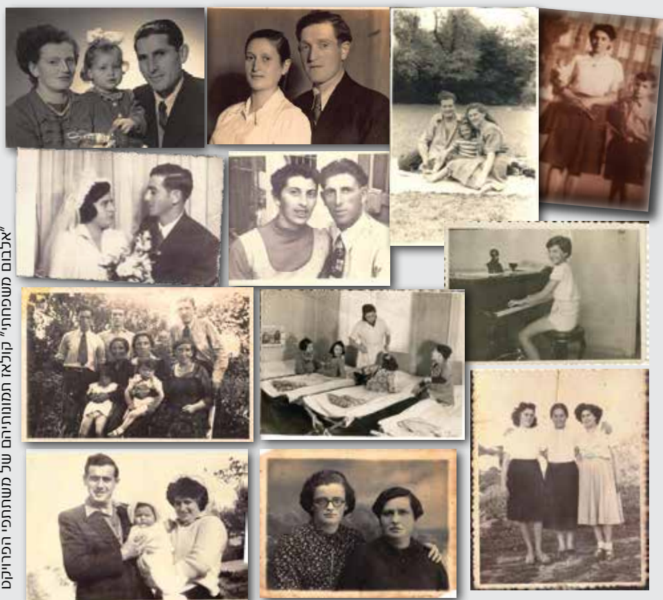
אלבום משפחתי "קולאז' המזמורת" של משתתפי הפרויקט