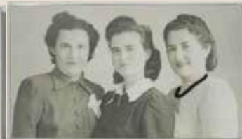
חיה, אמא והניה 2014, ברזל מרוחק וצילום 45x78x5