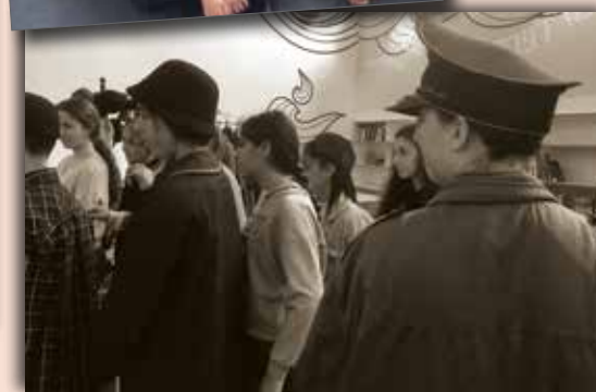
כל הלחנים והמנגינות בהצגה: עמרי דגן