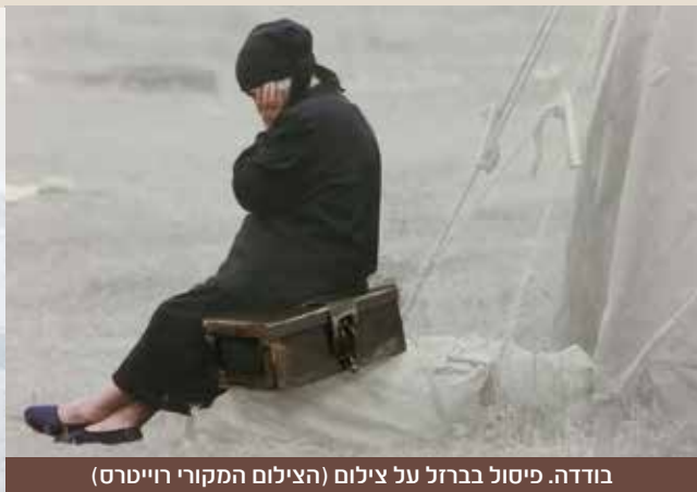
בודדה. פיסול בברזל על צילום