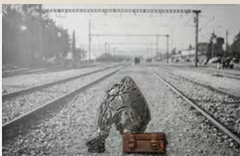
בתחנת הרכבת, ברזל מרוחק על גבי צילום