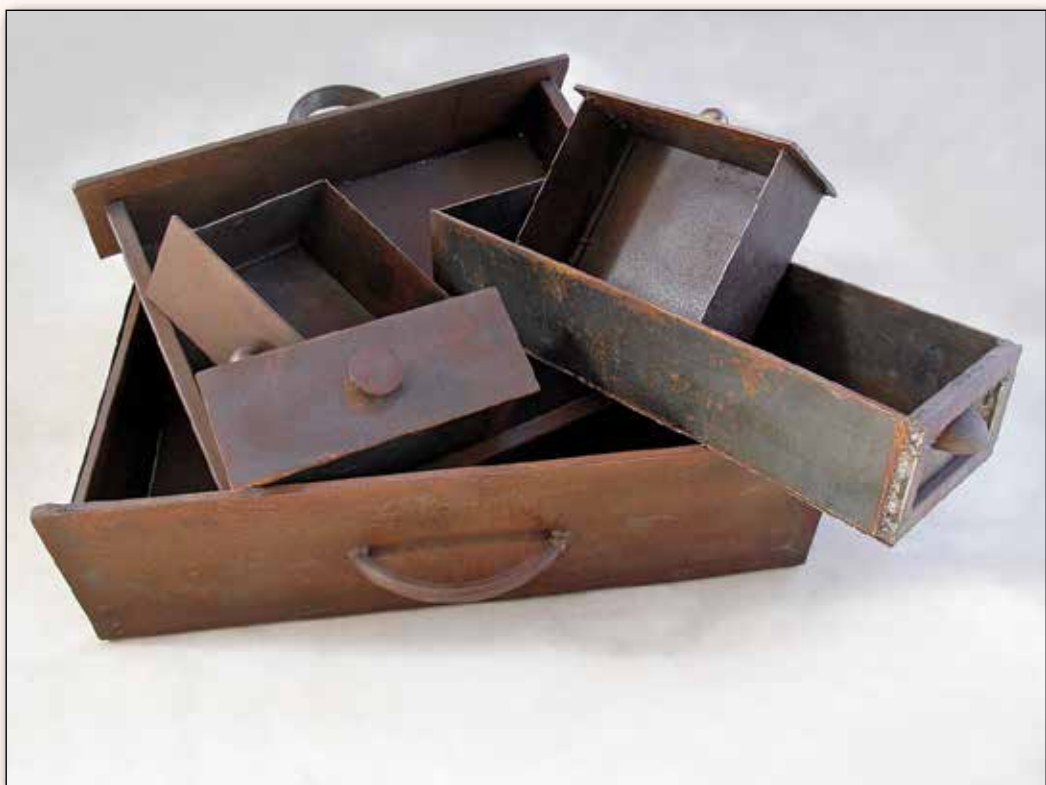
אורנה בו עמי | "זיכרונות 2", 2010, ברזל מחותך, מידות משתנות

יוצרי תיאטרון עדות – עירית ועזרא דגן, טיפול בדרמה, כתיבה בימיו והפקה