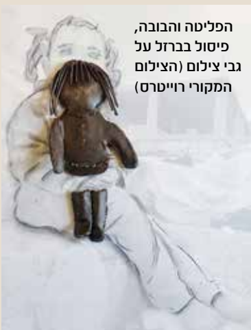
הפליטה והבובה, פיסול בברזל על גבי צילום