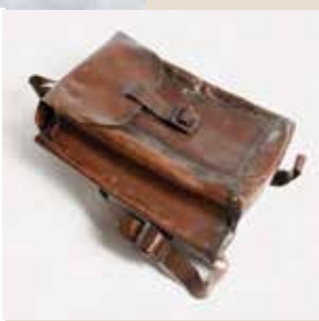
התרמיל, ברזל מרוחק