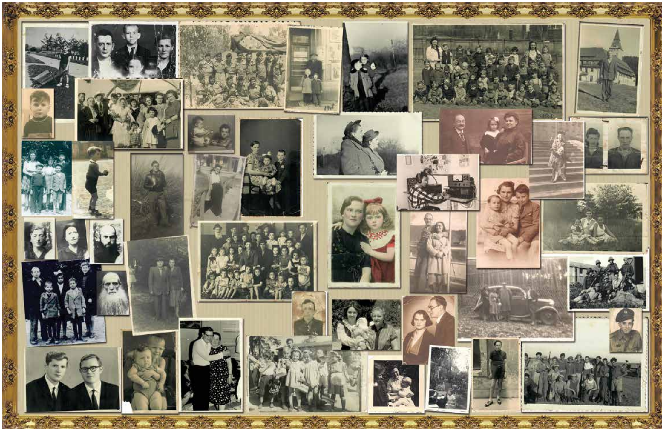
אלבום משפחתי - קולאי | עיצוב: שמיר גלי