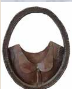
תמונתה על הקיר